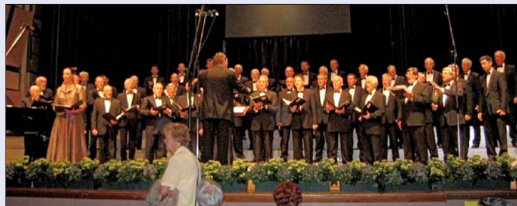
Mannenkoor Beeker Liedertafel; in 2005 uitgeroepen tot "Mannenkoor van het jaar."